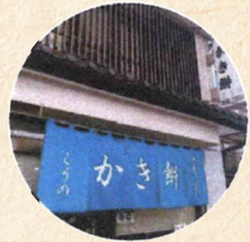
【手造りかき餅 こうの】

社会福祉法人「東京都手をつなぐ育成会」の作業所で作られたお菓子はどれも素材の味が感じられ、丁寧に美味しく仕上がっています。