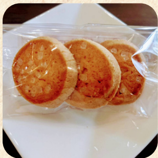
「杉並 すだちの里」 ざらめクッキー