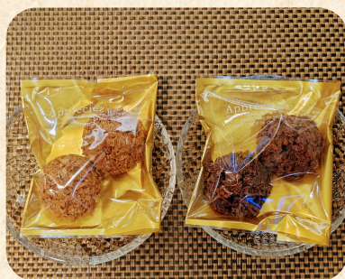
「SOMEI VILLAGE」 チョコクランチ