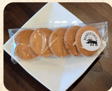
「渋谷まる福」 きな粉クッキー