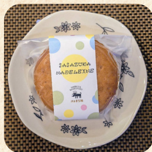
「渋谷まる福」 マドレーヌ