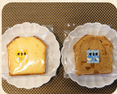
「bakery conoha」 パウンドケーキ