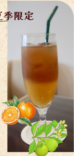
オレンジアイ스티ー 530円