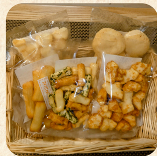
「手造りかき餅 ころの」 おかきせんべい